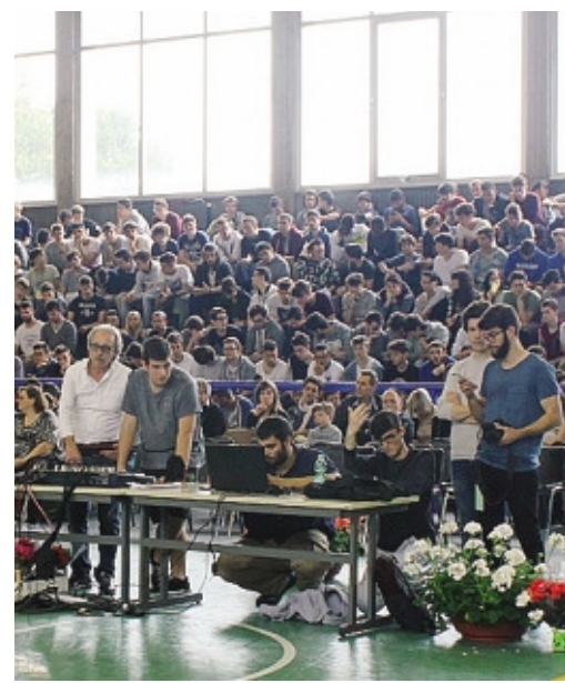
Le idee dei ragazzi sono state premiate in palestra