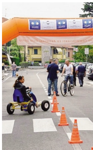
Numerose le iniziative previste

trattenere chi parteciperà all'evento, ci sarà anche l'accesso libero a giochi, attività sportive, concerti. «Osio sun day fun&shop», organizzato dalla Acea (Associazione commercianti e artigiani) di Osio Sotto, rappresenta la continuazione dell'«Exposio» che negli ultimi sette anni ha visto i commercianti scendere nelle strade del paese. Quest'anno