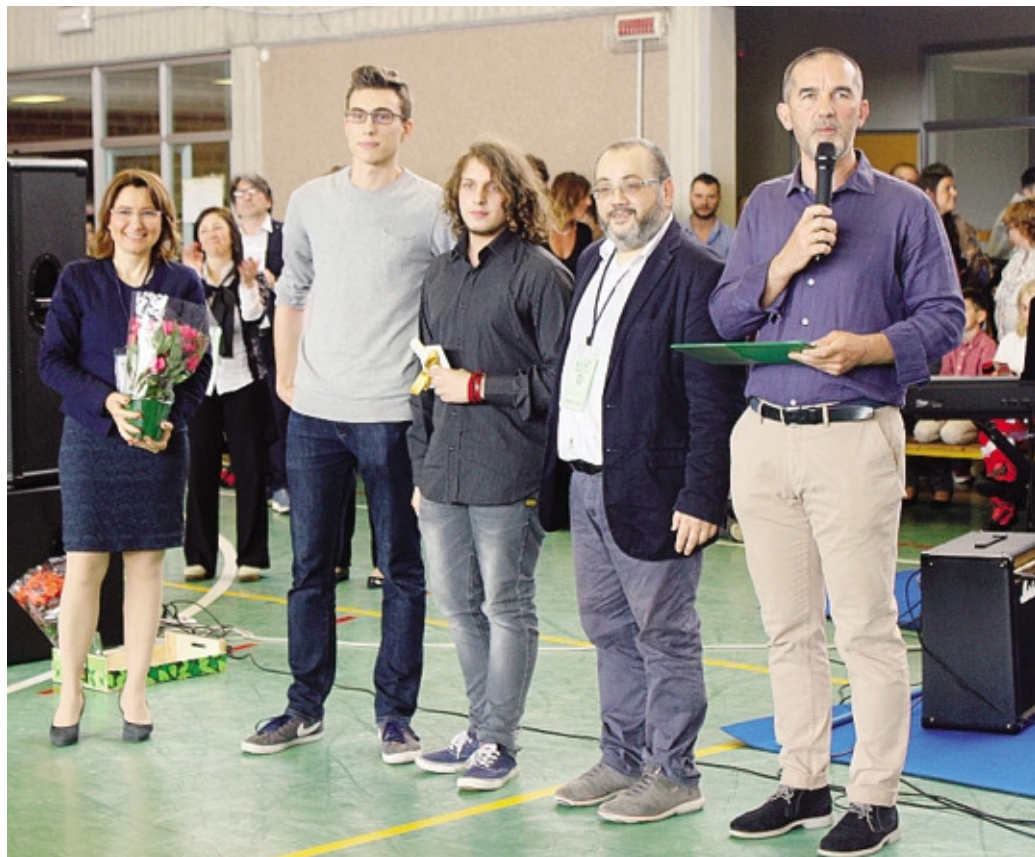
La premiazione dei rappresentanti della classe quinta AI, vincitori del «Marconi's Ideas day»